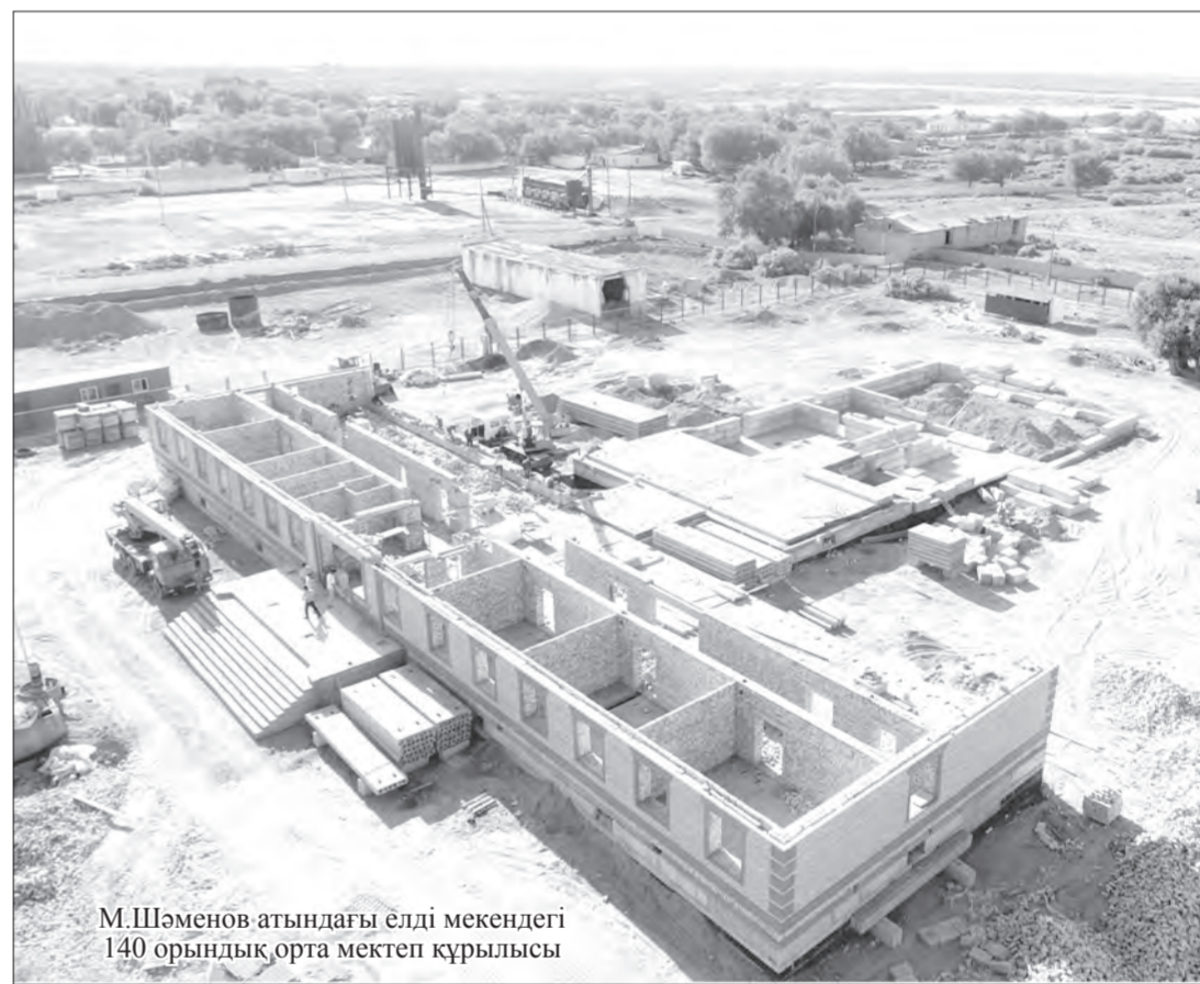
М.Шәменов атындағы елді мекендегі 140 орындық орта мектеп құрылысы

Әкім қабылдауынан шыға бере әкімдік жанынан салынып жатқан құрылыс жұмысына соқтық. Бұл мемлекеттік қызметкерлер мен бөлімдерге арналған аудан әкімдігінің жаңа ғимараты екен. Биыл құрылыс-монтаждау жұмыстарына облыстық бюджеттен қаржы бөлінген, «Real Stroy Invest» ЖШС мемлекеттік сатып алу жөніндегі атынып, тиісті жұмыстар басталып кеткен.