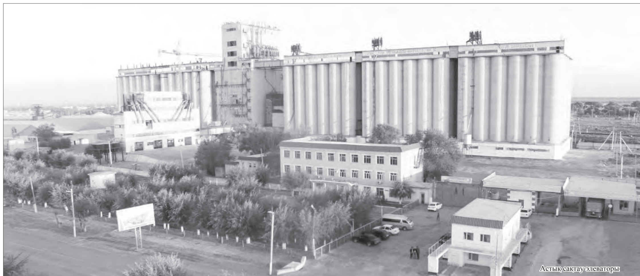
Астық сақтау элеваторы

Айтпақшы, көпірді жаңғырту жұмыстарын толық аяқтап шығу үшін қажетті 100 миллион теңгеден астам қосымша қаржы облыстық бюджеттен бөлінсе, нысанды пайдалануға бе-