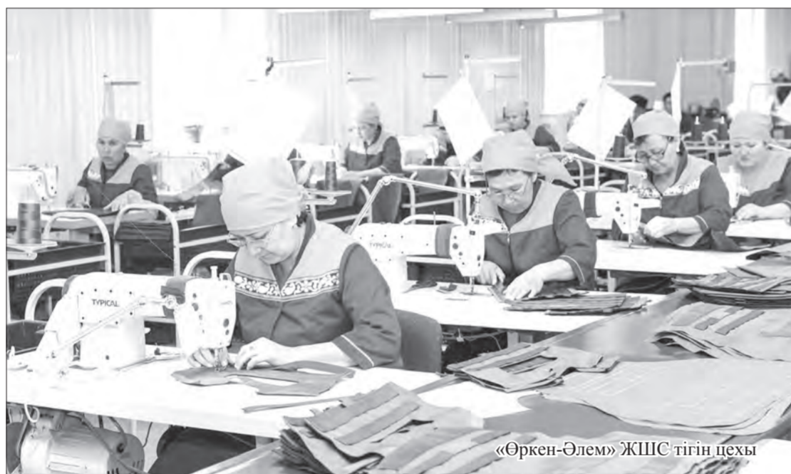
«Өркен-Әлем» ЖШС тігін цехы

– Құрылыс басында 20 шақты адам бар. Көпірдің тіреу бағандарының іргетасын құйып болдық. Енді бұйырса, күн суытма дегенше біраз жұмысты еңсеріп қалармыз. Биылғы бөлінгені – 153 миллион, ал жалпы көпір