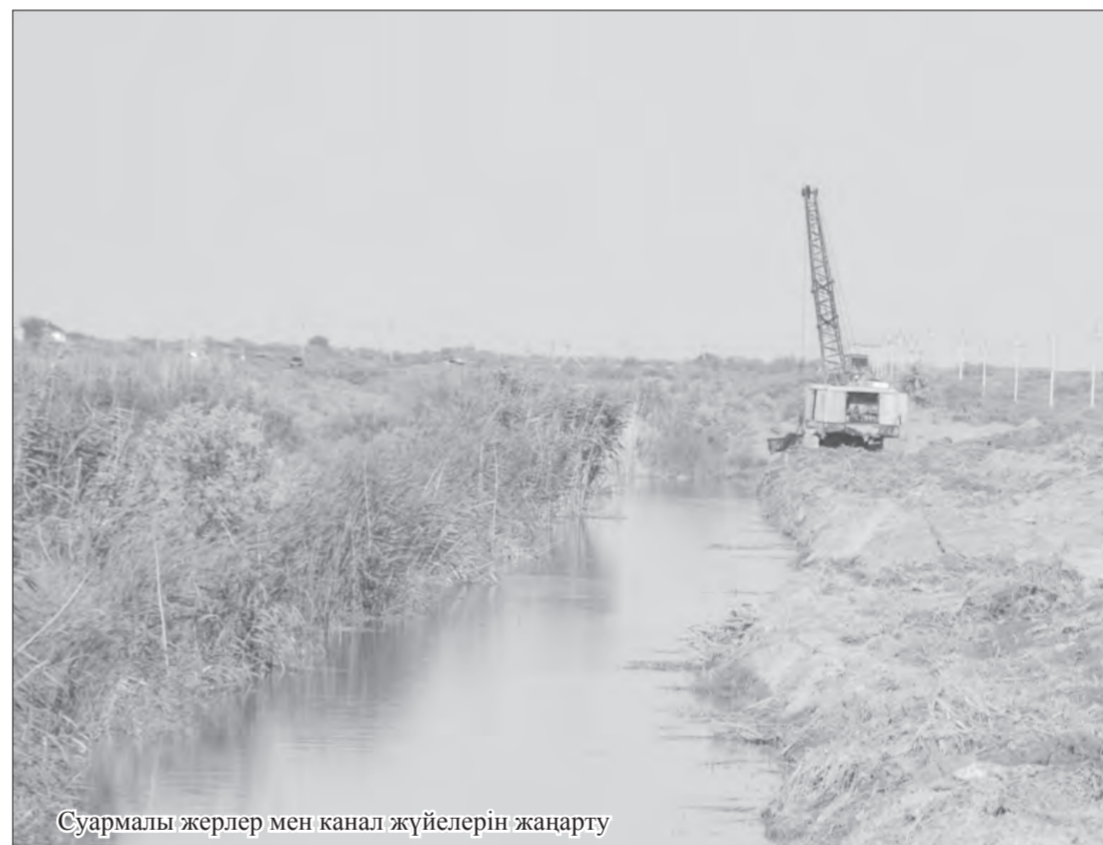
Суармалы жерлер мен канал жүйелерін жаңарту

Солдай деп ақпарат берді мұндағылар. Қолдағы дерекке сүйенсек, мемлекеттік сатып алудың қорытындысымен Теренөзек кентіндегі автоматтандырылған газ тарату станциясынан Жалағаштағы кент орталығына дейін магистральдық газ желісін тарту мен кентішілік газ желісінің құрылысын жүргізетін мердігер мекеме анықталған. «StroyGazCompany» ЖШС облыстық мемлекеттік сатып алу