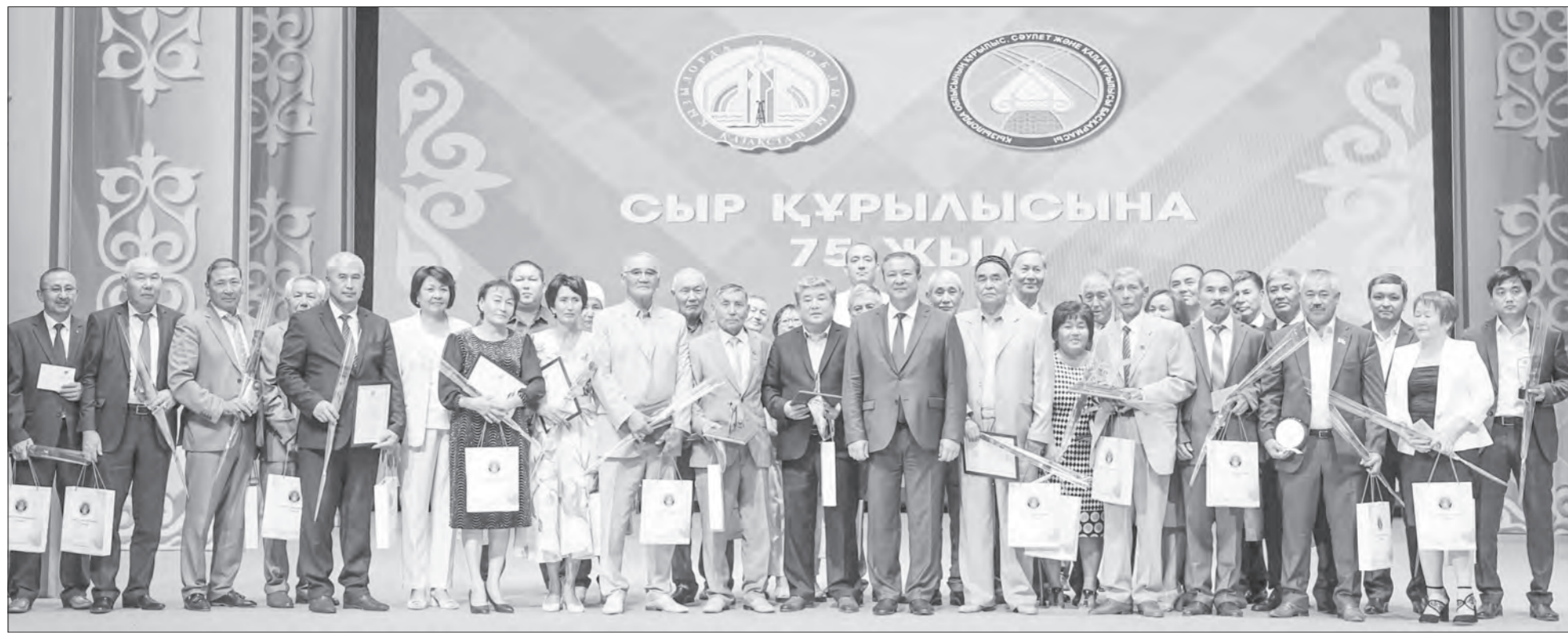
архив, баспасөз құжаттары мен естеліктер негізінде жазылған. Онда өңірдің даму тарихы, Қызылорда су торабы, целлолоза-картон зауыты, тоқылмайтын материалдар фабрикасы секілді XX ғасырдың алып құрылыстары, соның басы-қасында жүрген ардагерлердің естеліктері мен өмірбаяндарынан мәліметтер де бар. Сонымен қатар, ірі құрылыс мекемелері, пайдалануға берілген әсем де заманауи әлеуметтік нысандар