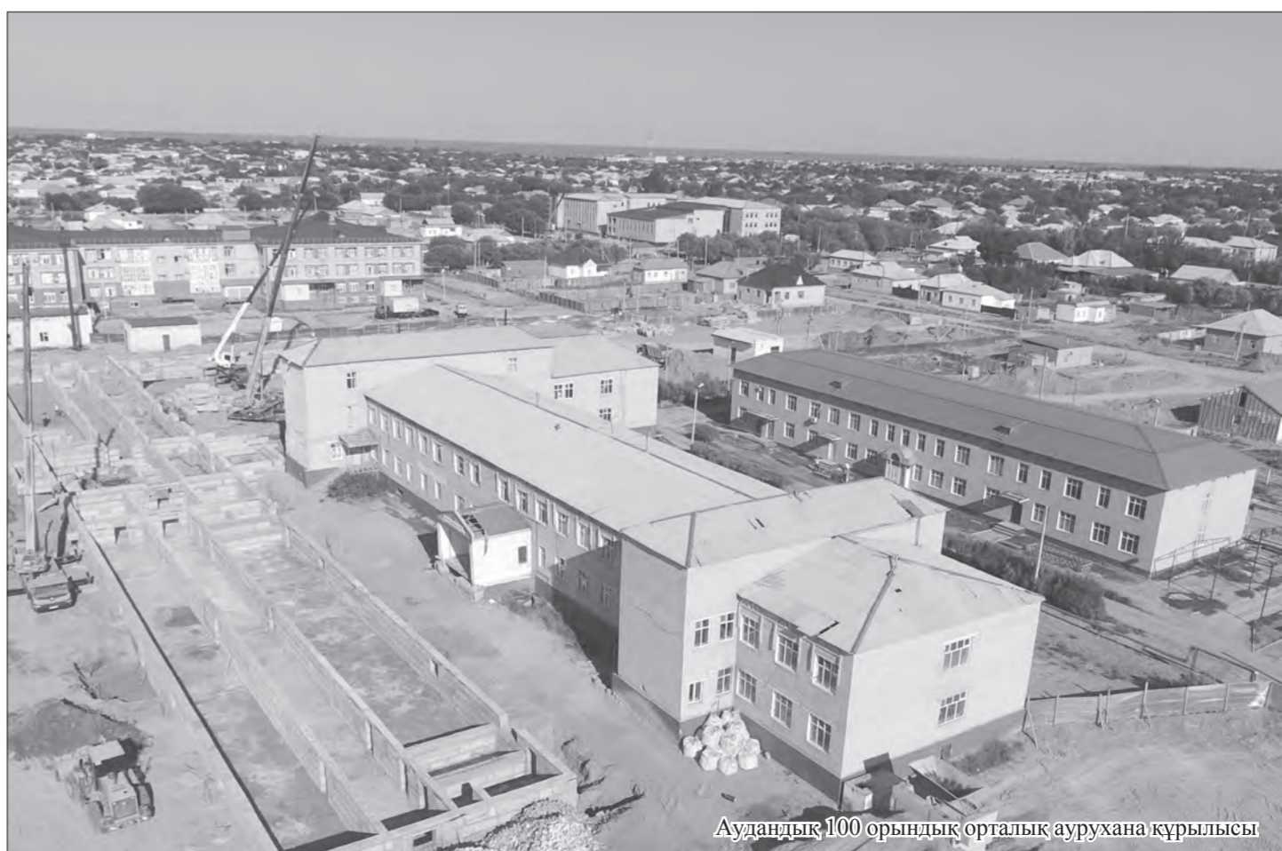
Аудандық 100 орындық орталық аурухана құрылысы