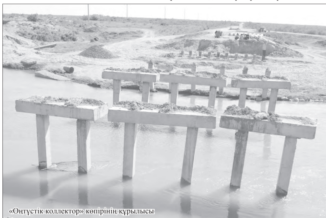
«Оңтүстік коллектор» көпірінің құрылысы

ТҮЙІН. Жалағаш ауданының даму үрдісі бүгінгіден де қарыштай беретініне атқарылған істер мен жүзеге асып жатқан жұмыстар өлшем бола алады. Қазақта «Саусақ бірікпей, иіне ілікпейді» деген қанатты сөз бар. Елде тыныштық пен бірлік болса, алдағы уақытта да аудан экономикасының қарқынды дамуына құтты қадамдар жасала береді. Жарқын болашақ пен кемел келешекті көздеген жалағаштық ағайынның бірлігіне іштей сүйсініп, өз мақсат-мұраттарын ілгерілету жолындағы айқын сарына сәттілік тілеп, біз де кері қайттық.