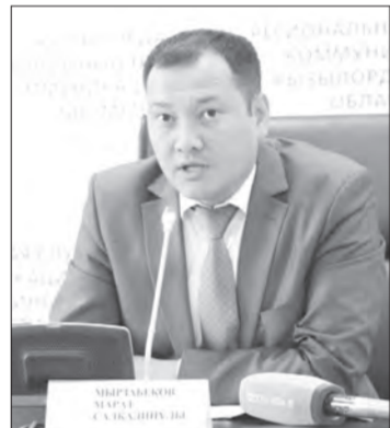
лардың айтуынша, мұнда мемлекет тапсырысы бойынша салынып жатқан құрылыс нысандары туралы сайтта

Тағы бірі – «Halyq Monitoring» жобасы. Маман-