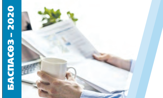
БАСПАСӨЗ – 2020

Кездесуде облыс әкімі жеке азаматтар қойған сауал-тілектердің барлығын арнайы саралап, жауапты орындарға тапсырма етіп жүктеді. Сонымен қатар, қабылдауда айтылған әрбір мәселе өз бақылауында болатынын жеткізді.