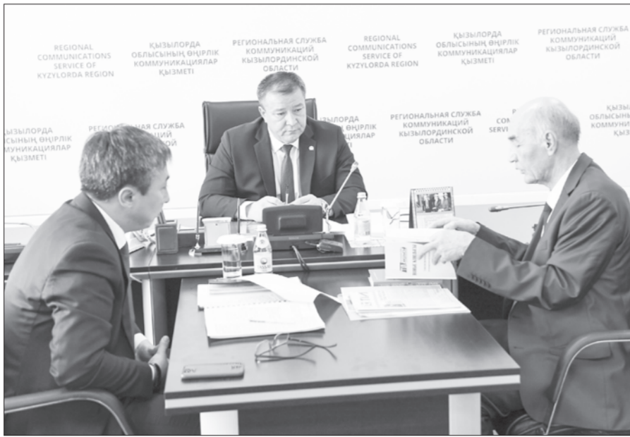
талды, – деді аймақ басшысы.

Азаматтарды қабылдау үзіліссіз 8 сағатқа жуық жүргізіліп, 70 адам аймақ басшысының қабылдауында болды. Келгендердің негізгі мәселесі – тұрғын үй, әлеуметтік қорғау, білім және денсаулық салаларына қатысты. – Соңғы жылдары қаламызда 15 жаңа шағын аудан бой көтеріп, 7 мыңнан астам қызылордалық баспаналы болды. Осы жылы тұрғыны төмен көпбалалы отбасыларды тұрғын үймен қамтамасыз ету үшін «Баламекен» жобасы аясында Болат Өтемұратовтың жеке қорының демеушілік қолдауымен 100 отбасы тұрғын үймен қамтылды. Сондай-ақ, бүгінде Сырдарияның сол жағалауында 25 көпқабатты тұрғын үйдің құрылысы аяқталып, кілті табыс-