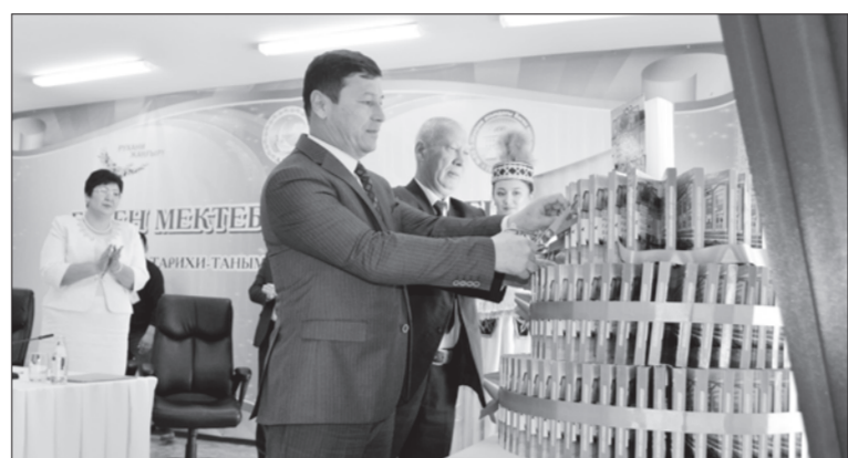
Н.Байқадамовтың құттықтау хаты ұстаздарға Білім және ғылым министрлігінің алғыс

Салтанатты шарада мектеп ұжымына ҚР Білім және ғылым министрлігінің, облыс әкімінің орынбасары