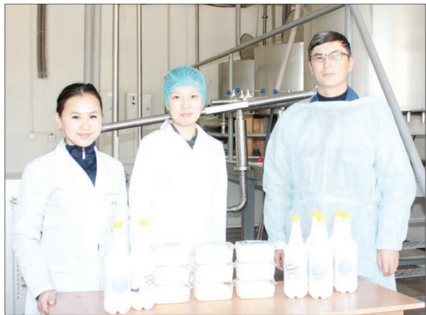
айран жасаймыз. Сепаратор арқылы қаймағын бөлек аламыз. Содан болмаса да халық игілігін көріп үлгерді. Мұнда айран, қаймақ, сүзбе, құрт, сарысу өңделеді. Тәулігіне 500 литр сүттен 1 тоннаға жақын өнім шығара алады. Мұндағы 21 млн теңге тұратын құрылғы Ресейдің Екатеринбург қаласынан әкелінген. Цехтың жанынан «Ақтайлақ» дүкені де ашылды. Өнімдерді осында саатады.