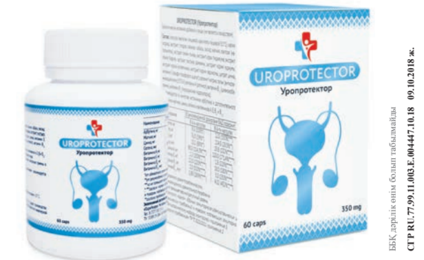
Негізгі әсер етуші заттар: препарат құрамына химиялық құраушылар кірмейді. Мөлшері және қолдану тәсілі: қабылдау уақыты 1 айдан бастап. Қарсы көрсеткіштер: жеке құраушылардың сәйкес келмеуі.

НАЗАР АУДАРЫҢЫЗ! НАУҚАН ЖҮРУДЕ! «УРОПРОТЕКТОР» КУРСТЫҚ БАҒДАРЛАМАСЫНА ТАПСЫРЫС БЕРСЕҢІЗ, -30% ЖЕҢІЛДІК!