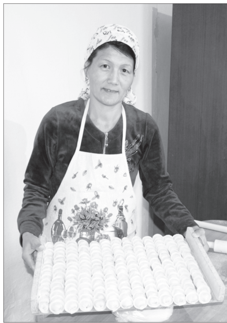
Бар. Мықты кәсіпкер болу үшін нарықпен санасу керек, – дейді ол. Сұранысқа сай өнім дайындау сападан басталады. Бастысы, елге қажеттіні кәсіп қылып ашу керек. Сөйтсе сұраныс та жоғары болады.

– Бастысы – клиенттің көңілі. Бір мәрте көңілі қалған жан екіншілей есік қақпайды. Сондықтан, шаршасак та, талсақ та берілген тапсырысты орындауға бар күш-жігерімізді жұмсаймыз. «Өзін ісінді дамыт, дамытпасаң, басқаға жол бер» деген нарық заңдылығы