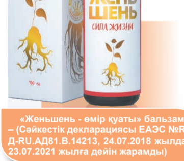
«Женьшень» - өмір қуатын бальзамы - (Сәйкестік декларациясы) ЕАЭС №RU Д-RU. АӘБ1. В.14213. 24.07.2018 жылдан 23.07.2021 жылға дейін жарамды

Табиғат женьшеньді мінсіз қылып жаратқан. Қазіргі заманауи технологиялардың негізгі мақсаты женьшеньнің барлық пайдалы қасиеттерін сақтай отырып, дәрінің ең тиімді түрін жасап шығару.