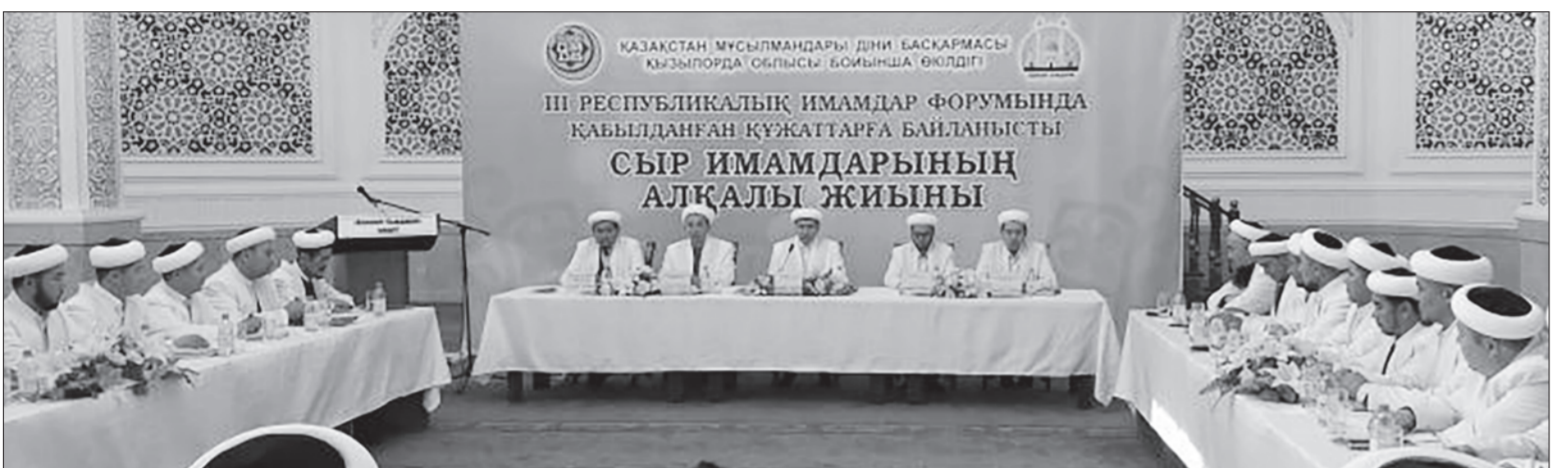
ҚАЗАҚСТАН МҰСЫЛМАНДАРЫ ДІНИ БАСҚАРМАСЫ ҚЫЗЫЛОРДА ОБЛЫСЫ БОЙЫНДА ӨКІЛДІГІ ІІІ РЕСПУБЛИКАЛЫҚ ИМАМДАР ФОРУМЫНДА ҚАБЫЛДАҒАН ҚҰЖАТТАРҒА БАЙЛАНЫСТЫ СЫР ИМАМДАРЫНЫҢ АЛҚАЛЫ ЖИЫНЫ

«Ақмешіт-Сырдария» орталық мешітінде ІІІ республикалық имамдар форумында қабылданған құжаттарға байланысты аймақ имамдарының алқалы жиыны өтті. Онда Қазақстан мұсылмандары Діни басқармасы қабылдаған «ҚМДБ құрылымындағы діни лауазымдар тізілімі және міндеттері», «Жеті рухани қазық» Қазақстан мұсылмандарының тұғырнамасы, діни қызметкерлер атқаратын рәсімдер кенінен талқыланды.