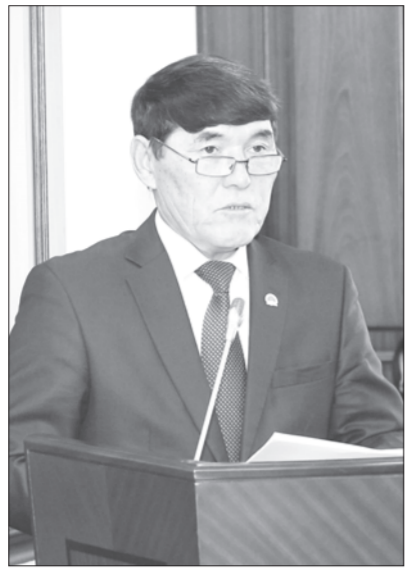
екенін, одан бөлек, жұмыс орнын көрсетуде жалған цифр ұсынбауды ескертті.

– Жыл басында «Дорстрой» серіктестігі Қорқыт ата зиярат ету орталығын жеке кәсіпкерге жалға берген. Кәсіпорында жоспарға сәйкес 15 жұмыс орны құрылу керек болса, облыстық мемлекеттік кірістер