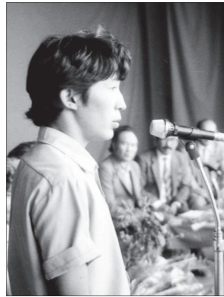
Қызылорда қаласындағы А.Тоқмағанбетов атындағы мәдениет үйінде 2019 жылдың 29 қарашасы күні сағат

Әділ Ботпановтың шығармашылығына арналған кеш