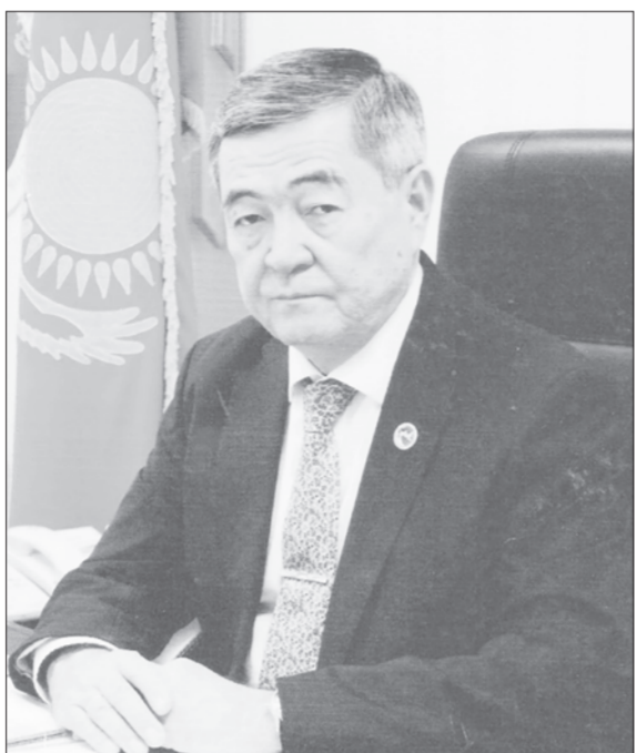
Елбасы тәуелсіздік жылдары Қызылорда облысының, ондағы еңбексүйгіш халықтың ертеңіне қажетті бірнеше ірі жобалардың іске асуына бастамашы болды. Елбасының Сыр өліне жасаған әрбір сапарынан мұндағы халықтың келешекке деген сенімі арта түсті. Ұлт көшбасшысының ыстық пейілі мен ықыласы, ағайынға арнаған лебіздері жұртшылықтың көңілін көтерді.

Қазақтың кең-байтақ даласының қай өңіріне де кіе қонған, құт дарыған. Сонымен қатар, тұтас түркі әлемі Сыр бойын атамекеніміз деп таниды. Ұлы дарияның бойында орналасқан қазақтың ежелгі астаналары бұл мекеннің тарихтағы орнын айшықтап тұрғандай. Елбасының осы өлкені «Сыр – Алаштың анасы» деп атауында айрықша мән бар. Біздің өңірімізде қазақ халқының келешегіне қатысты талай тағдырлы шешімдер қабылданғаны тарихтан белгілі.