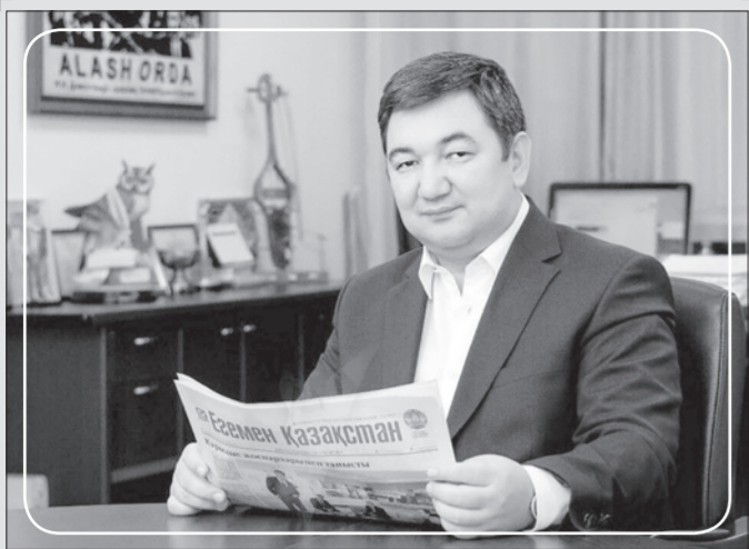
Құрметті Аманжол Сақыпұлы! Қадірлі әріптестер!

Сыр өңірінің ғасырға жуық тарихын тасқа басқан байырғы басылым – «Сыр бойы» газетінің 90 жылдық мерекесі құтты болсын!