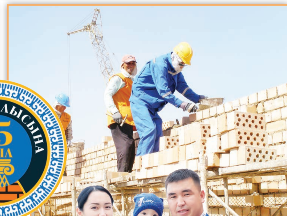
2019 жылы 761 мың шаршы метр тұрғын үй пайдалануға берілді.