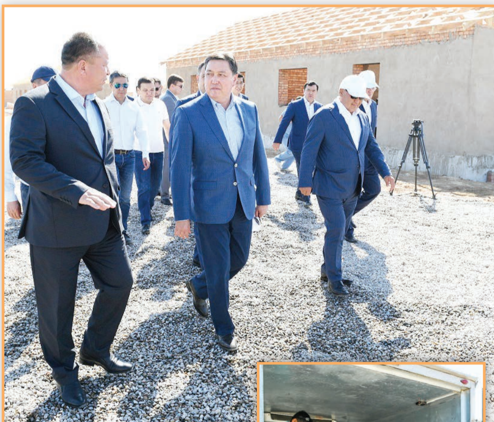
Арыс, біз біргеміз! Сыр құрылысшылары Арыстағы жағдайға ерекше үлес қосты.