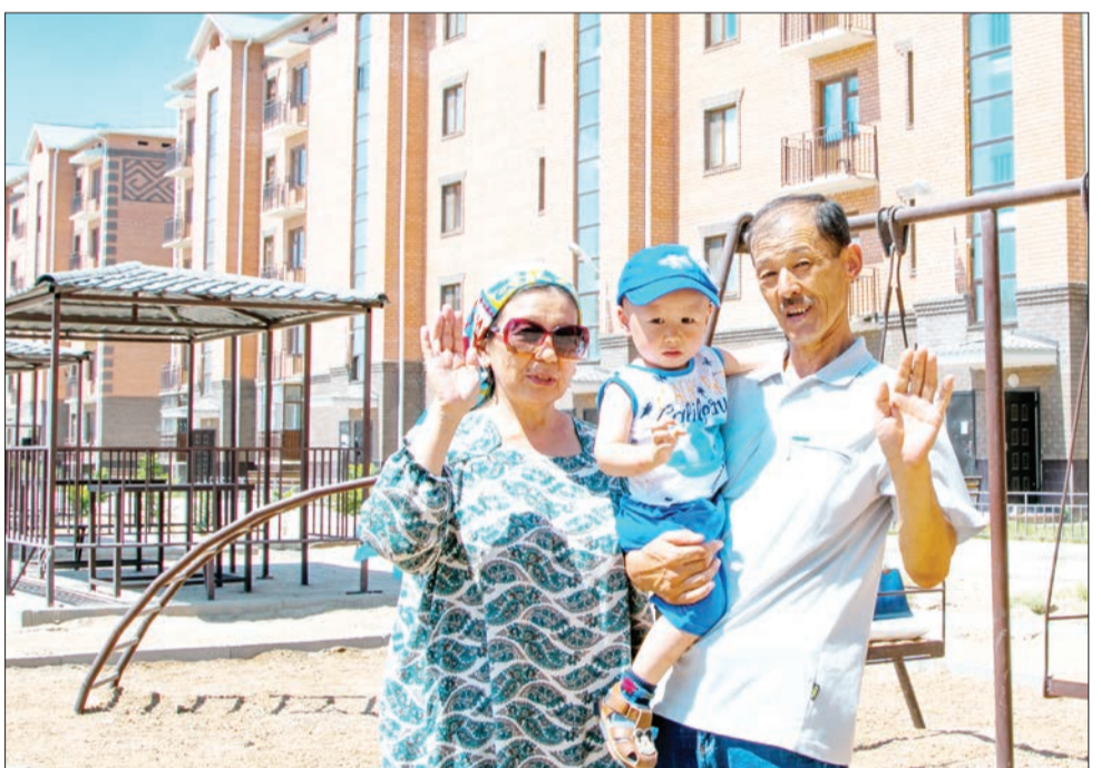
2019 жылы Шиелі ауданының Бестам, Төңкеріс ауылдарында, Жанакорған ауданының орталығы мен Сүттіқұдық ауылында, Жалағаш ауданының Таң

рынды балалар үшін интернат-колледж мектебіне күрделі жөндеу жүргізілді. Жосалы кенті мен Қазалы ауданының Әйтеке би кентіндегі орталық ста-