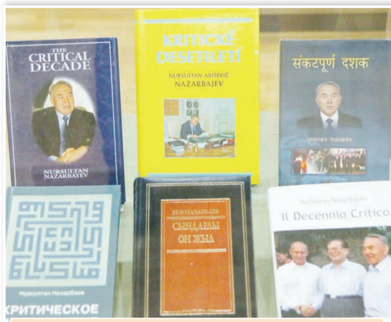
«Н.Назарбаев: дәуір, тұлға, қоғам» көшпелі қор көрмесі Қызылордада.