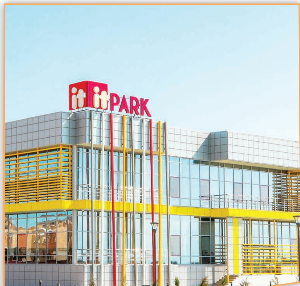
Жастар жылы: Сырдарияның сол жағалауында Жастар ресурстық орталығы ашылды.