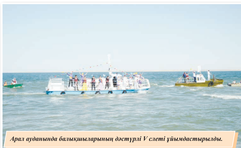
Арал ауданында балықшыларының дәстүрлі V слеті ұйымдастырылды.