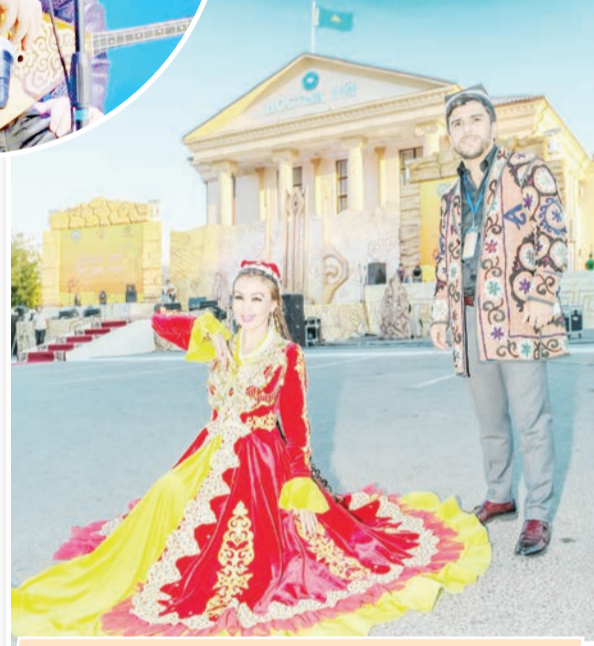
Татулық тамыры тереңде.