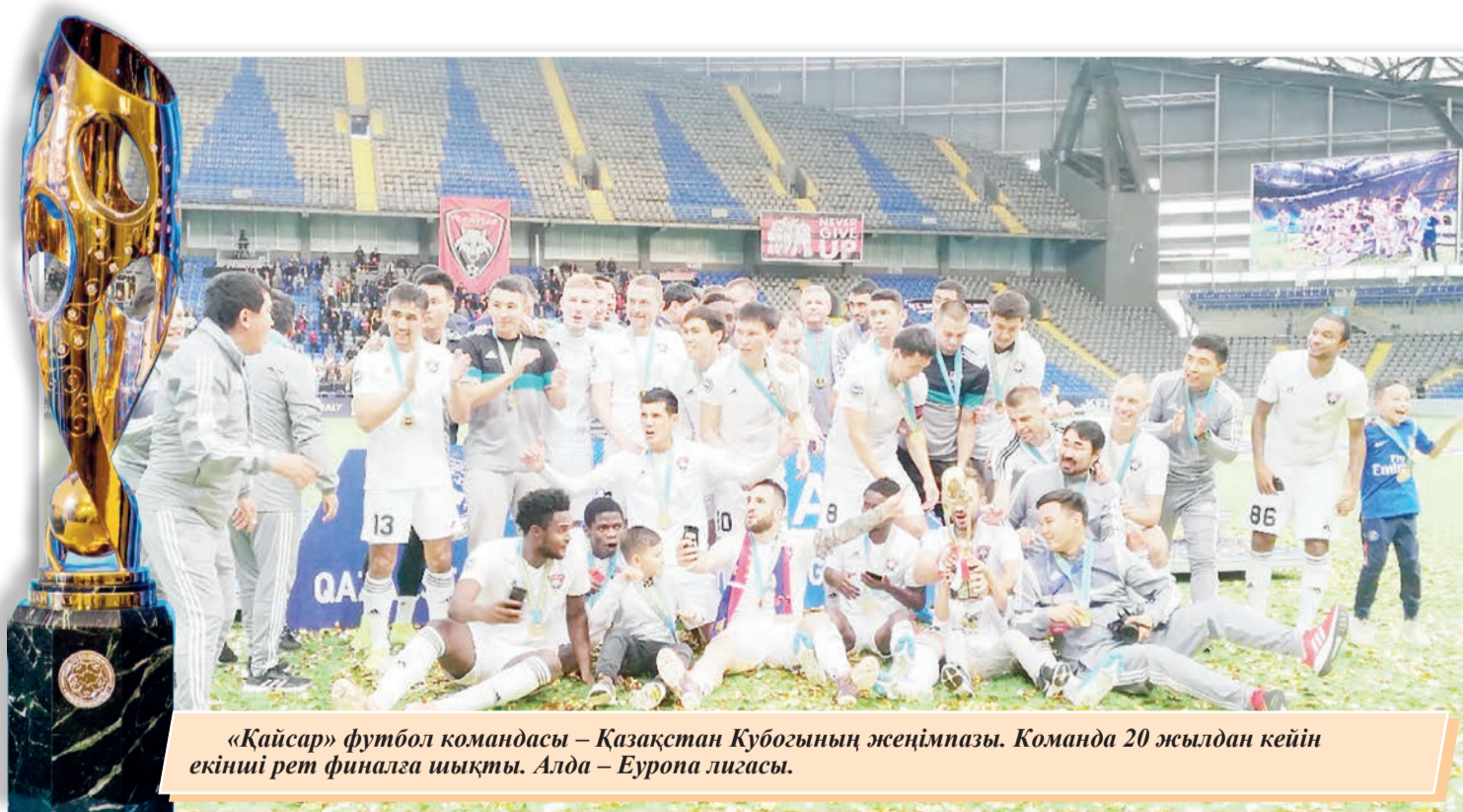
«Қайсар» футбол командасы – Қазақстан Кубогының жеңімпазы. Команда 20 жылдан кейін екінші рет финалға шықты. Алда – Еуропа лигасы.