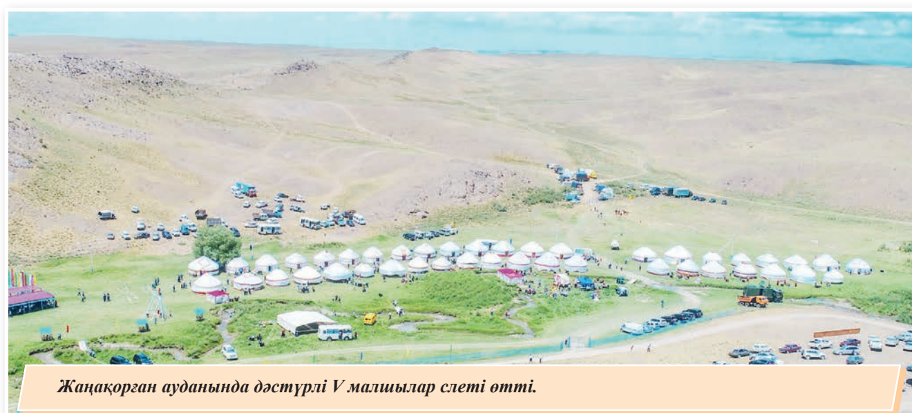
Жаңақорған ауданында дәстүрлі V малышлар слеті өтті.