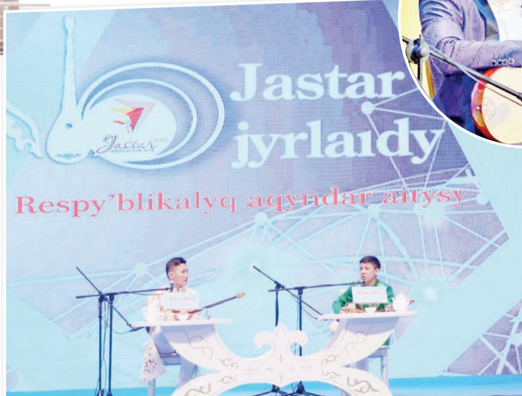
«Жастар жырлайды» республикалық ақындар айтысы.