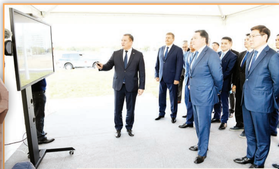
ҚР Премьер-Министрі Асқар Мамин Байқоңыр қаласының әлеуметтік-экономикалық дамуымен, сондай-ақ гарни саласындағы бірлескен жобалардың іске асырылу жағдайымен танысты.