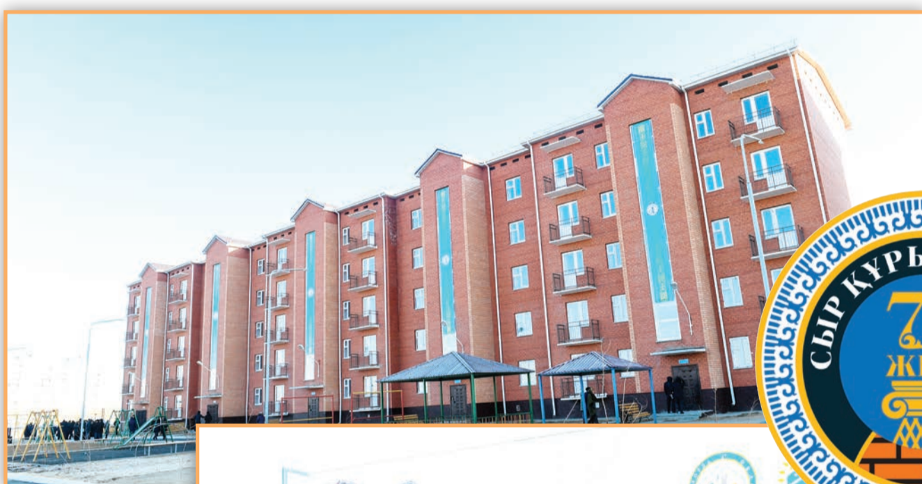
Байқоңыр қаласында 5 көпқабатты тұрғын үй пайдалануға берілді. Бұл – «жұлдызды қалашықта» соңғы 30 жылда салынған жаңа құрылыс.