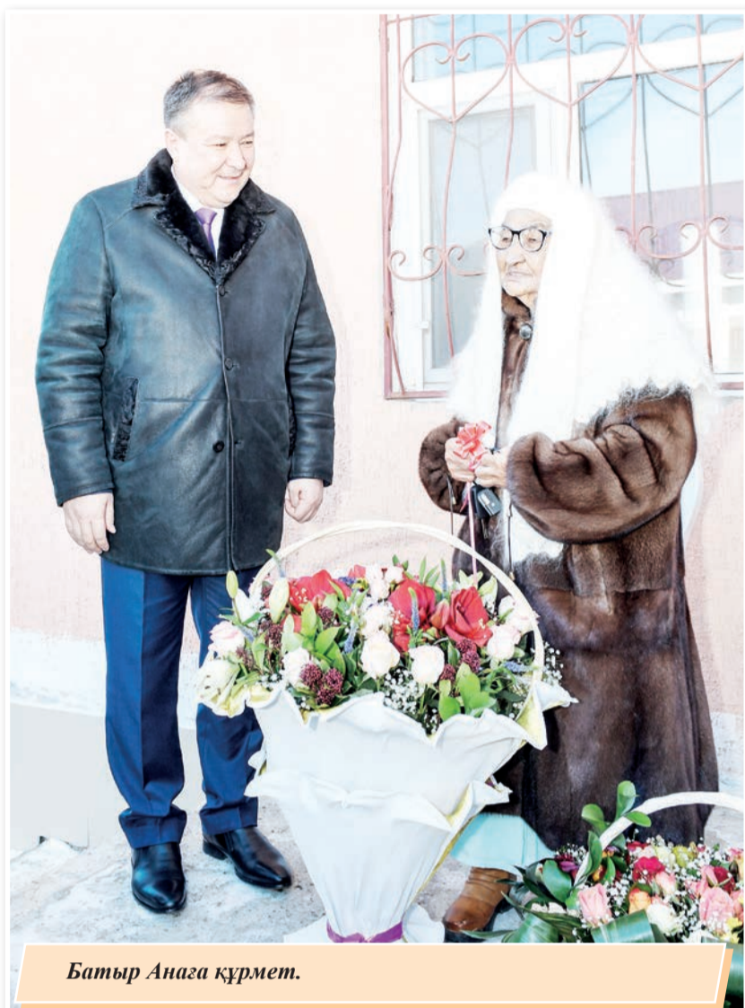
Батыр Анаға құрмет.