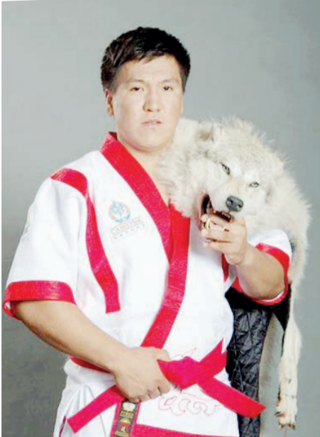
Сыр спортышылары – әлемдік аренада.