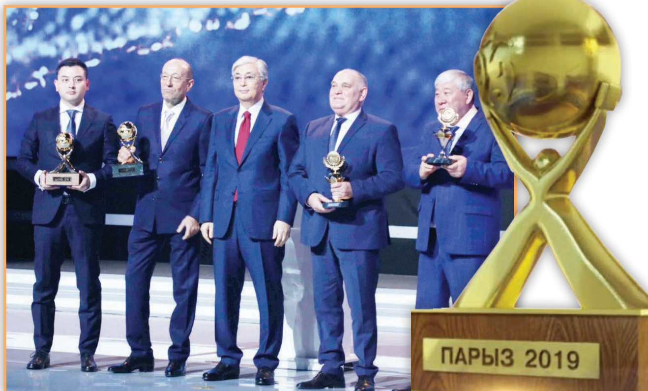
«Абзал және К» компаниясы «Парыз» сыйлығының «Үздік әлеуметтік жауапты кәсіпорын» номинациясы бойынша алтын жүлдесін алды. Ал «Алтын сапа» сыйлығының «Үздік инновациялық жоба» номинациясы бойынша – «СКЗ-У», «Азық-түлік тауары және ауыл шаруашылығы өнімін шығаратын үздік кәсіпорын» номинациясы бойынша «Мағжан және К» компаниялары марапатталды.