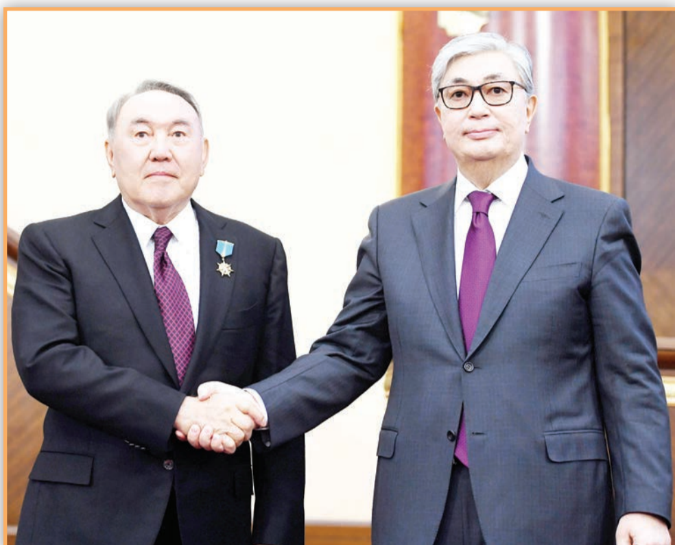
Нұрсұлтан Назарбаев 2019 жылғы 20 наурыздан бастап Қазақстан Республикасының Президенті өкілеттігін атқаруды тоқтатты. 9 маусымда өткен ҚР Президентінің кезектен тыс сайлауында Қасым-Жомарт Тоқаев жеңіске жетті.