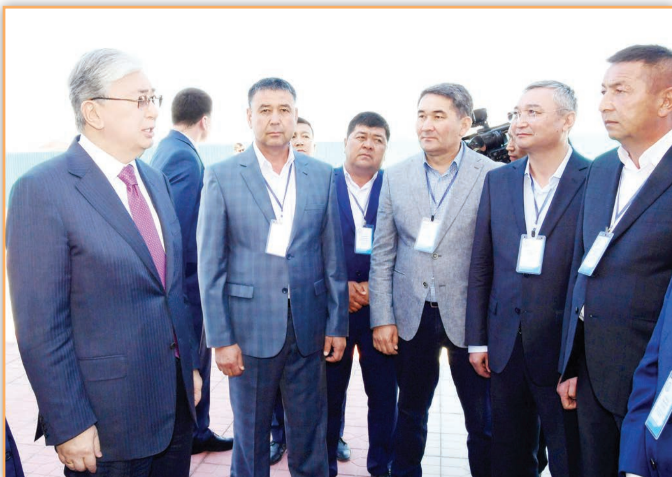
Қазақстан Президенті Қасым-Жомарт Тоқаев Қызылорда облысында жұмыс сапары кезінде.