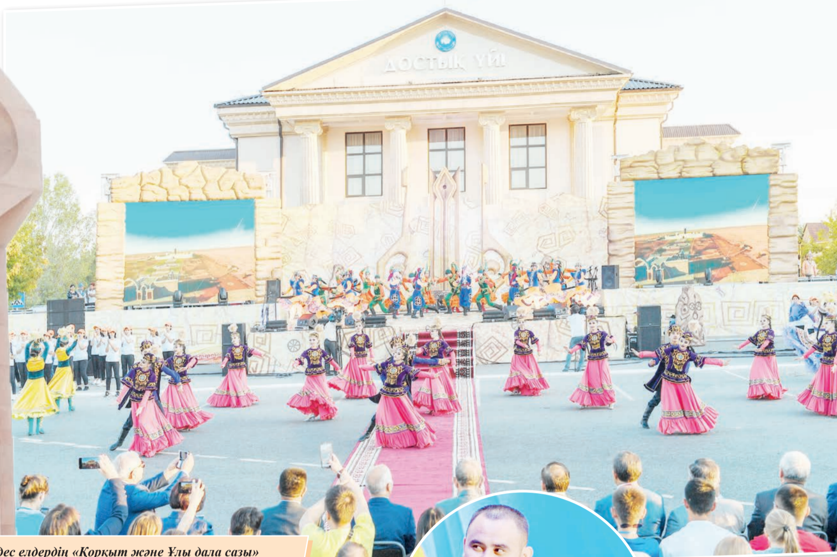
Түркітілдес елдердің «Қорқыт және Ұлы дала сазы» халықаралық фольклорлық-музыкалық өнер фестивалі.